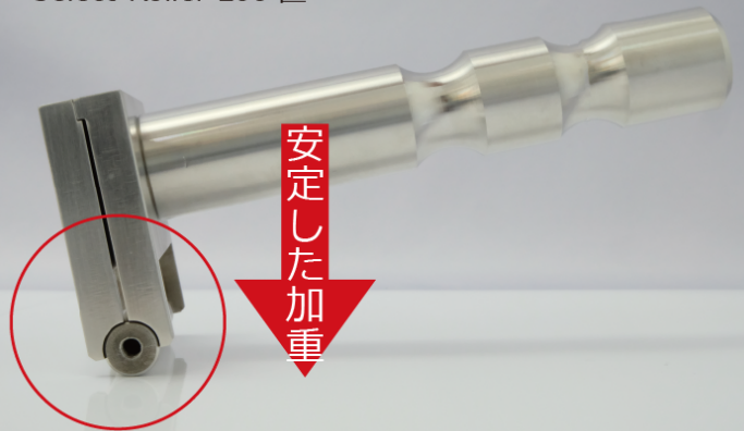
Select-Roller L60 匠