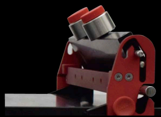
パーリフター機能(全機種標準装備)