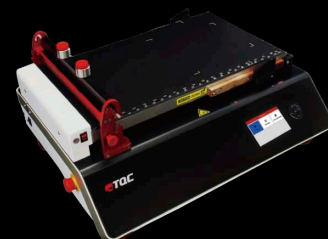
ヒートバキュームモデル