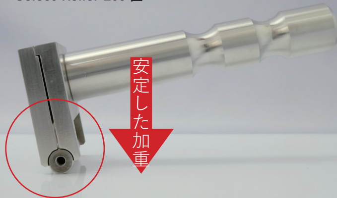
Select-Roller L60 匠